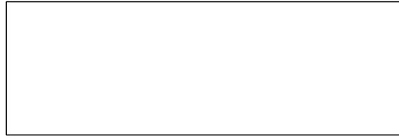
图 2 热气旁通除霜