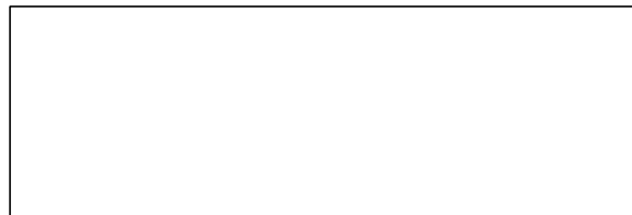
图 4 逆向循环除霜